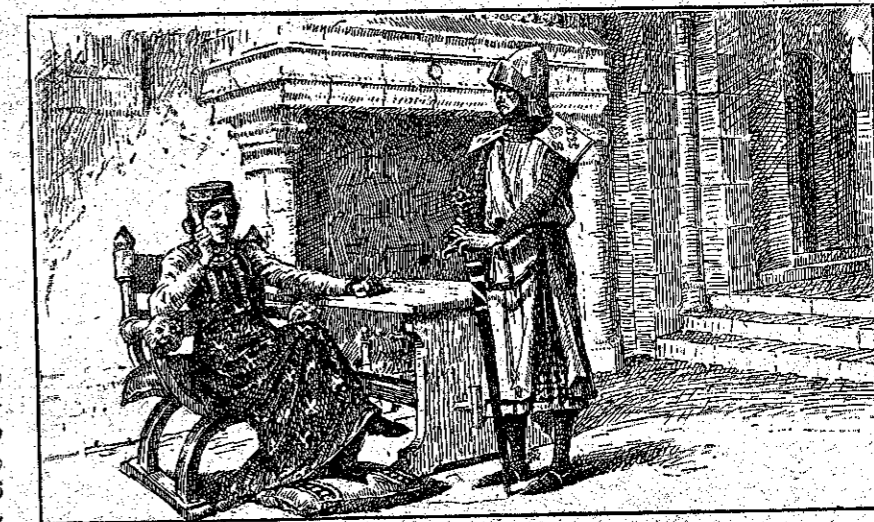
« Ποτε δέν με ἠπάτησαν τὰ προαισθημάτα μου. » (Σελ. 41, στήλ. α΄.)